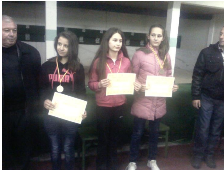
Успех на учениците во централното училиште по учебни години

Психологот реализираше Програма за советување на родители согласно сопствената програма за работа. Во советувањето беа вклучени родители чии деца имаат несоодветно поведење, голем број изостаноци и намалување на училишниот успех.