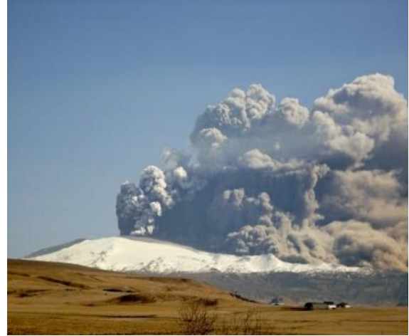
Сл.3 Вулканот Хекла

Во јужниот дел владее атлантска клима со свежи лета и благи зими, а во северниот субполарна. Од реките позначајни се Нордирау, Тјоурсау и др., а има и езера.