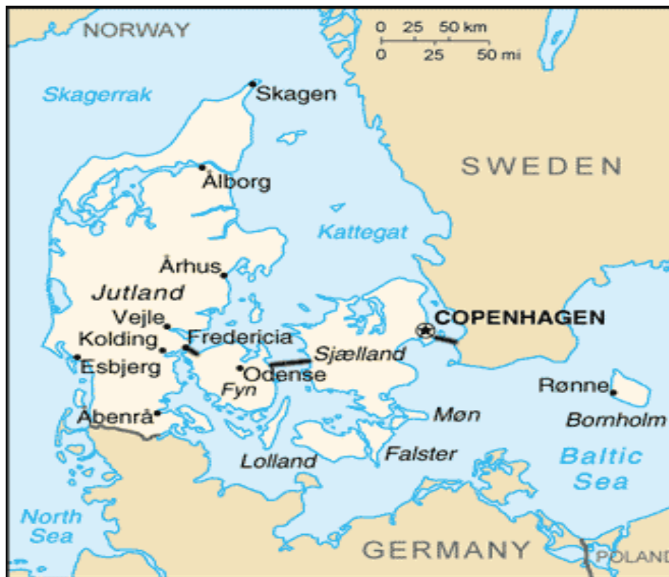
Сл.1 Географска положба на Данска

Данска е полуостровска и островска земја, бидејќи 2/3 е на полуостровот Јиланд, кој го одделува Северното од Балтичкото Море, а 1/3 се наоѓа на 92 острови кои лежат околу овој полуостров. Меѓу нив поважни се: Селанд, Лоланд, Фалстер, Фин, мен и др. Географска положба на Данска е доста добра. Во тоа придонесуваа повеќе фактори меѓу кои и фактот што полуостровскиот и островскиот дел се многу доближени до Скандинавскиот Полуостров така што Данска е природен мост меѓу Северна и Средна Европа и фактот што патот од Север(од Балтичкото Море) води преку протоците Скагерак и Категат кои ја заобиколуваат Данска.