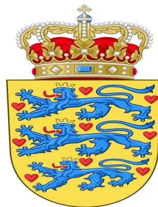
Сл.3 Знаме и грб на Данска

Службен јазик е данскиот, кој спаѓа во германската група на јазици, а на регионално ниво се користат инуитскиот на Гренланд, фарскиот и германскиот.