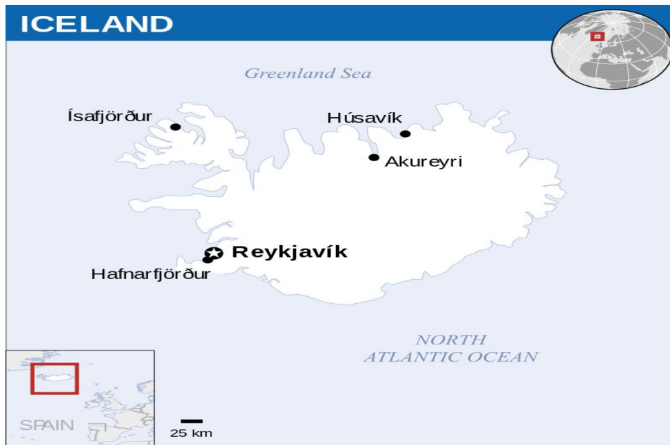
Сл.1 Географска положба на Исланд

Исланд е островска земја (втор остров по големина во Европа, после Велика Британија) која е оддалечена над 1000км од европското копно. Се наоѓа во северниот дел на Атлантскиот Океан, до самиот северен поларен круг. Зафаќа површина од 103 000км 2 .