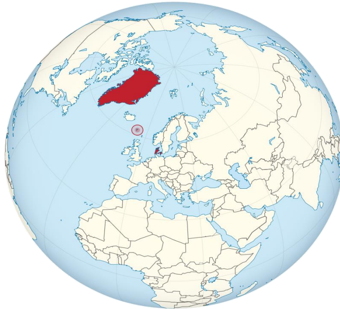
Сл.2 Географска положба на Гренланд(обоен црвено) и Фарските Острови(заокружени со црвено)

Данска има копнена граница само на југ кон Германија, додека од другите три страни е обиколена со мориња. Во овие граници зафаќа површина од 43 075 км 2 .