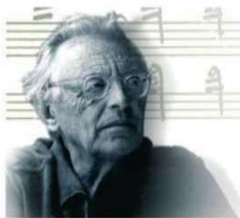
Карл Орф (1895-1982)

Орфови инструменти - го добиле името по композиторот Карл Орф. Тој развил метода со која децата преку ритам и поезија, танци и едноставни инструменти, ја осознаваат и изведуваат музиката. Оваа метода често се нарекува "едноставно музицирање", бидејќи децата со леснотија ја совладуваат техниката на свирење на овие инструменти. Голем дел од своето творештво им го посветил токму на децата.